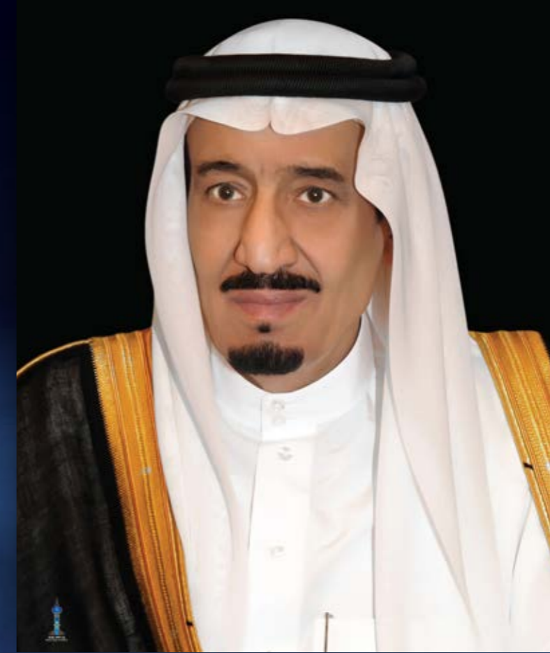
الملك سلمان بن عبد العزيز آل سعود

ولي العهد رئيس مجلس الوزراء ورئيس مجلس الشؤون الاقتصادية والتنمية