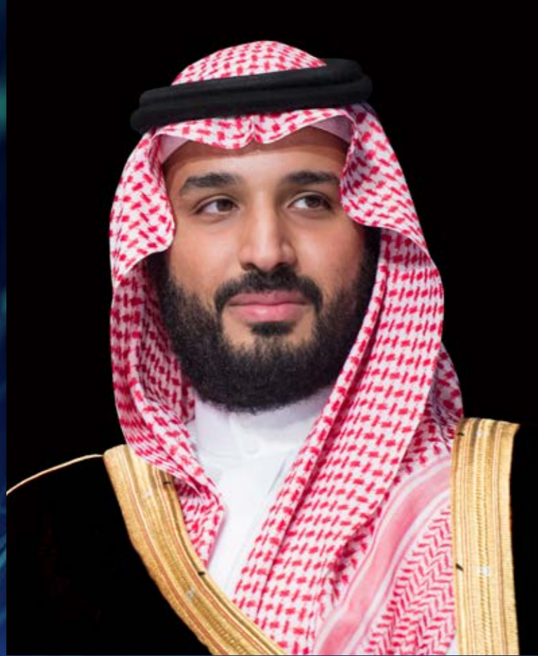
صاحب السمو الملكي الأمير محمد بن سلمان بن عبد العزيز آل سعود

ولي العهد رئيس مجلس الوزراء ورئيس مجلس الشؤون الاقتصادية والتنمية